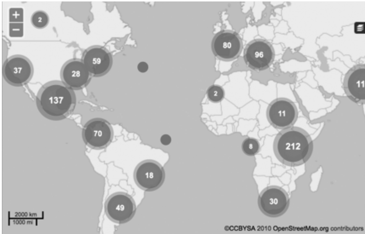
Figura 3. Mapeo de casos por violencia a través del uso de la tecnología a nivel mundial.